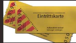
전시회 초대권 지원