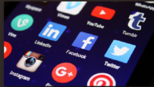
회사/제품 홍보 지원