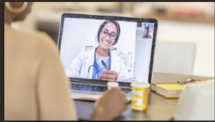
전시회 예산 확보 지원