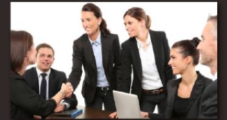
1:1 바이어매칭 지원